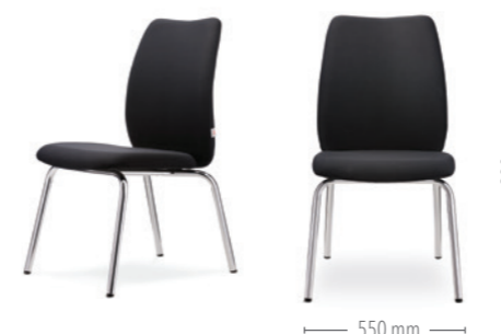
Vierbeinstuhl ohne Armlehnen