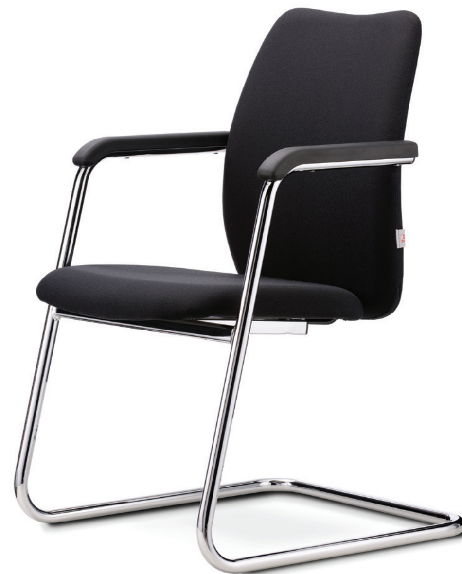
Abbildung mit PU-Armauflagen

Auch in stapelbarer Ausführung erhältlich.