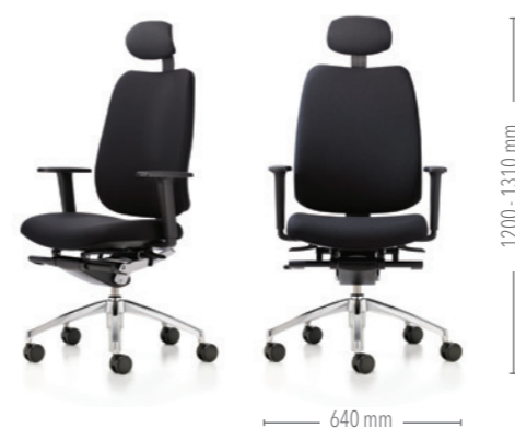
Mit hoher Rückenlehne, Kopfstütze und dynamischer Synchronmechanik