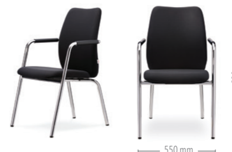
Vierbeinstuhl mit Armlehnen