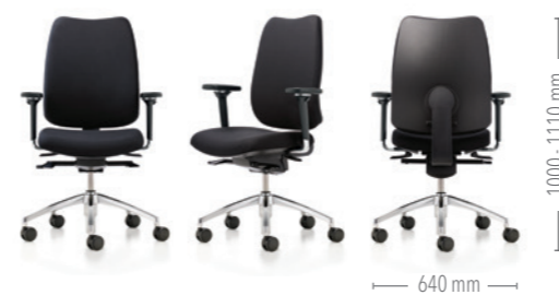
feeling light mit Synchronmechanik und Rückenstab aus Kunststoff