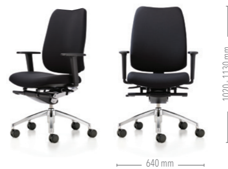
Mit hoher Rückenlehne und dynamischer Synchronmechanik